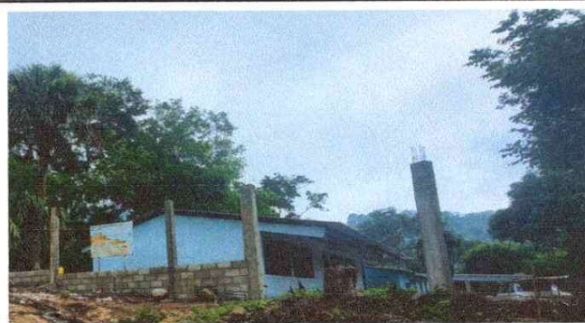
Foto 2: Retiro de portón en mal estado, para su posterior sustitución.