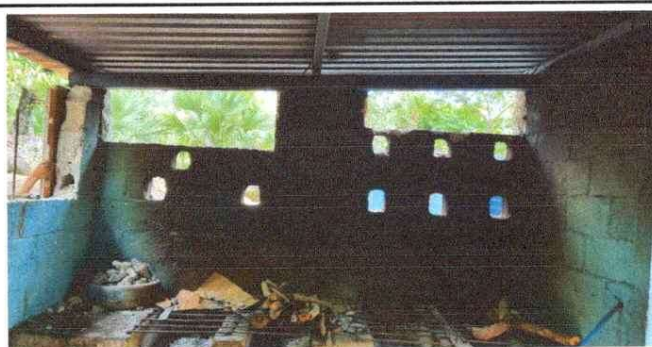
Foto 6: Apertura de boquetes en la pared del área de cocina, para posterior instalación de balcones de barrotes.

Observación: Si es necesario se pueden agregar hojas adicionales y actualizar el número de hojas.