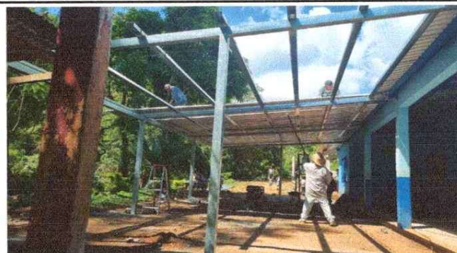
Foto 4: Instalación de lámina troquelada calibre 26 en área de patio.