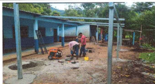
Foto 3: Trabajo de instalación de estructura metálica galvanizada de soporte de techo en galera-corredor.