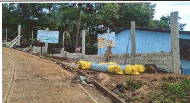
Foto 1: Proceso de ampliación de muro perimetral, sustitución de malla metálica con base de block y tubo galvanizado y columnas de concreto