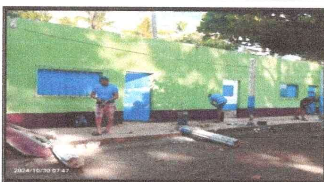
Foto 4: Módulo Aulas, mejoramiento de ventanas, puertas, pintura y muros.