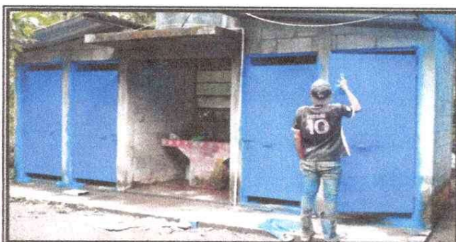
Foto 5: Módulo Baños, reparación de puertas, cambio de accesorios, de tazas y cambio de tubería para tinaco.