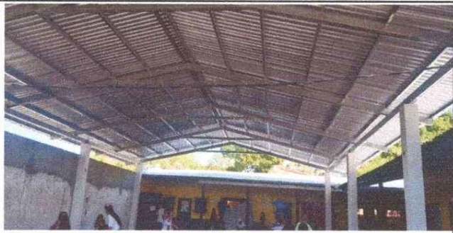
Foto 3: MEJORAMIENTO DE TECHO DEL PATIO CON LÁMINA TROQUELADA CALIBRE 26"