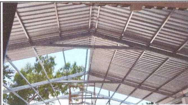
Foto 3: MEJORAMIENTO DE TECHO DEL PATIO CON LÁMINA TROQUELADA CALIBRE 26"