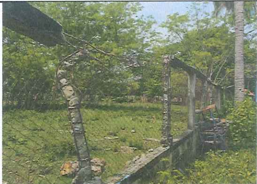
MÓDULO 4. REPARACIÓN DEL MURO PERIMETRAL