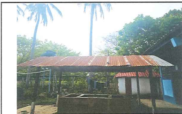
MÓDULO 5. REPARACIÓN DE GALERA DE PILA Y BASE DEL DEPÓSITO DE AGUA