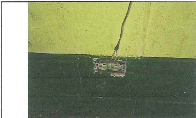
MÓDULO 3. REPARACIÓN ELECTRICA EXTERNA E INTERNA