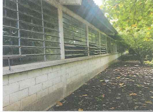
MÓDULO 2. PINTURA EXTERNA E INTERNA DE ESCUELA