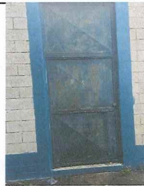
MÓDULO 6. REPARACIÓN Y MANTENIMIENTO DE PUERTAS

Observación: Si es necesario se pueden agregar hojas adicionales y actualizar el número de hojas.