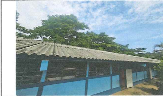
MÓDULO 1. SUSTITUCIÓN DE TECHADO