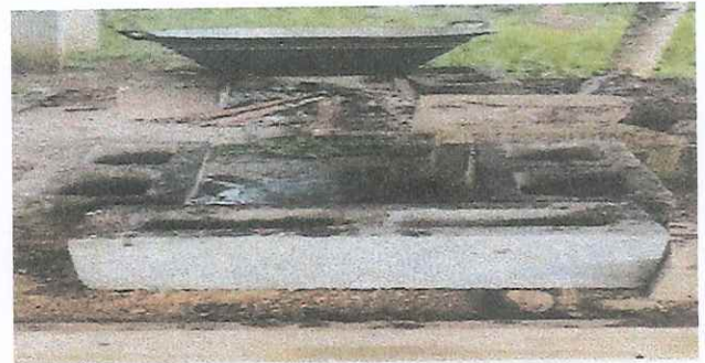
Foto 4: Polleton improvisado en inadecuado y en mal estado a mejorar con block y cemento.