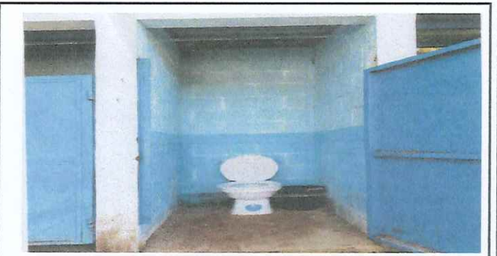
Foto 10: Servicios sanitarios incompletos para instalación de tanques con sus accesorios y tazas nuevas.

Observación: Si es necesario se pueden agregar hojas adicionales y se deben agregar 6 hojas.