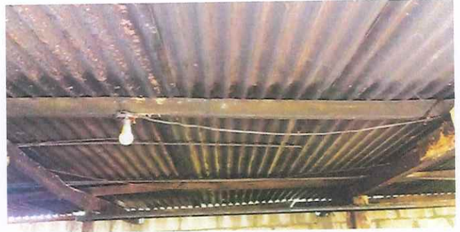
Foto 2: Estructura de soporte de techo en cocina con serios daños a sustituir con estructura portante galvanizada.