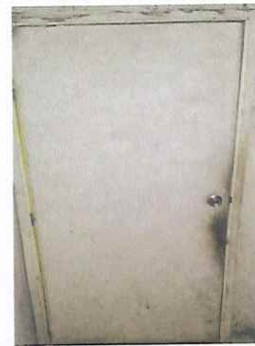
Foto 6: Puerta de cocina presenta daños, se sustituirá con puerta metálica,

Observación: Si es necesario se pueden agregar hojas adicionales y actualizar el número de hojas.