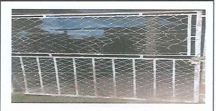
Foto 8: Portón principal desempotrado/desencajado de su lugar con daños. A reparar y reinstalar