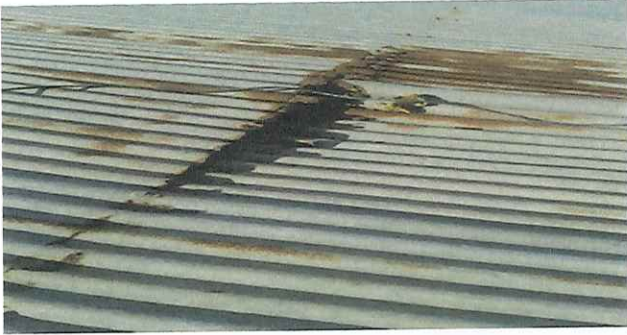
Foto 1: Lámina de cocina en mal estado a sustituir con lámina troquelada calibre 26.