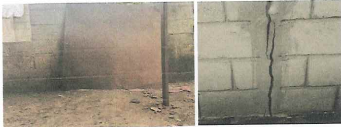
Foto 3: Paredes de cocina en malas condiciones para reparar, reforzar, mejorar y ampliar.