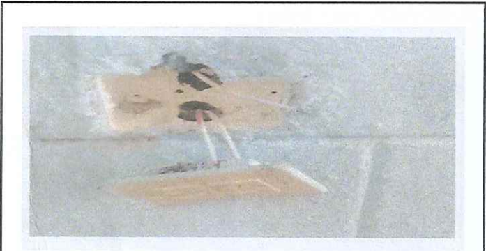
Foto 9: Suministros y red eléctrica en aulas y dirección presentan fallas y daños, se requiere sustitución.