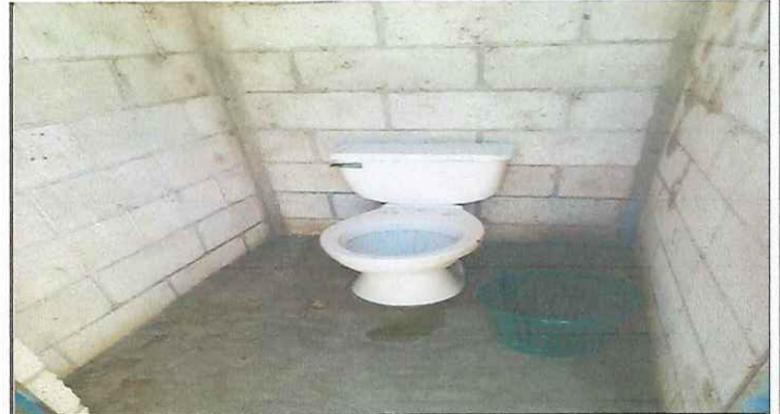
MODULO 2. SUSTITUCION DE INODORO EN MAL ESTADO