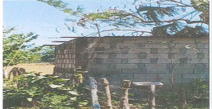
MODULO 3. SUSTITUCION DE PAREDES Y MEJORAS EN EXTERIOR E INTERIOR DE COCINA.

Observación: Si es necesario se pueden agregar hojas adicionales y actualizar el número de hojas.