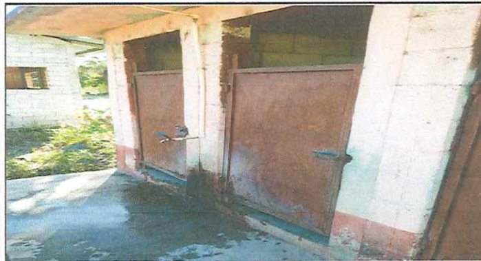
MODULO 2. SUSTITUCION DE PUERTAS DE BAÑOS EN MAL ESTADO