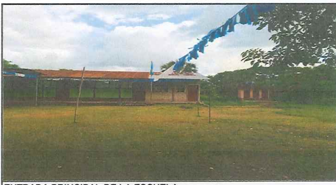
ENTRADA PRINCIPAL DE LA ESCUELA

Observación: Si es necesario se pueden agregar hojas adicionales y actualizar el número de hojas.