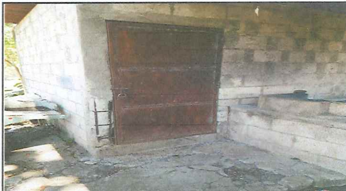
MODULO 3. SUSTITUCION DE TORTA DE CONCRETO, MANTENIMIENTO DE ESTUFA RURAL Y MANTENIMIENTO DE PUERTA