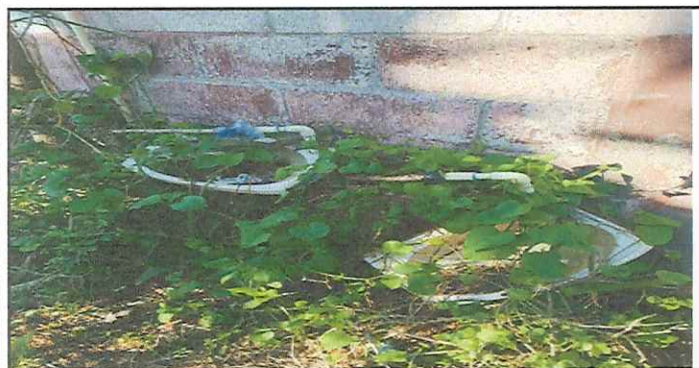
MODULO 2. SUSTITUCION DE LAVAMANOS EN MAL ESTADO