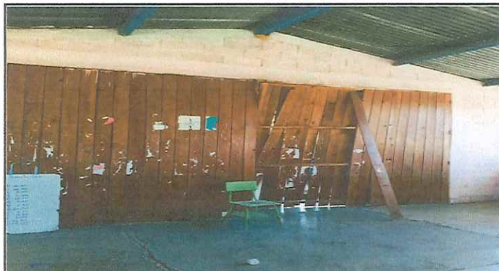
MODULO 1. SUSTITUCION DE MURO DE BLOCK EN MAL ESTADO