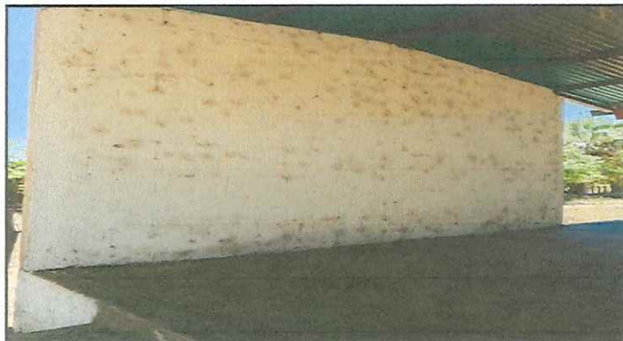
MODULO 4. ESCENARIO REPELLO Y PINTURA