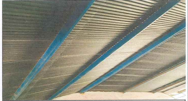
MODULO 1. ESTRUCTURA EN BUEN ESTADO SE LE DARA MANTENIMIENTO DE CEPILLADO Y PINTURA.