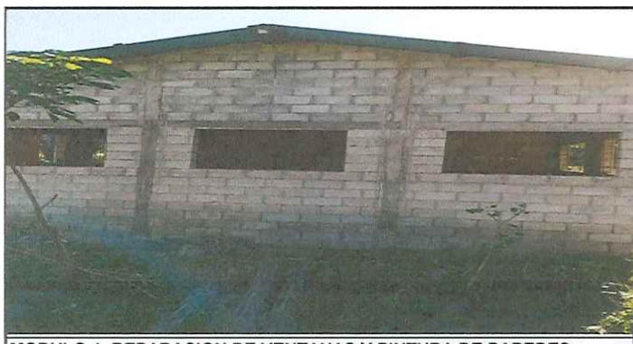
MODULO 1. REPARACION DE VENTANAS Y PINTURA DE PAREDES