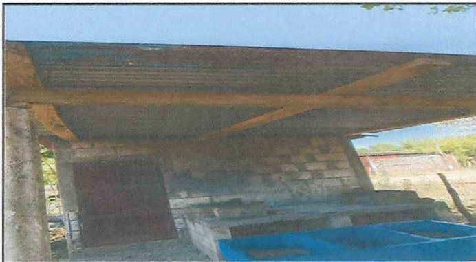
MODULO 3. SUSTITUCION DE LAMINA Y ESTRUCTURA