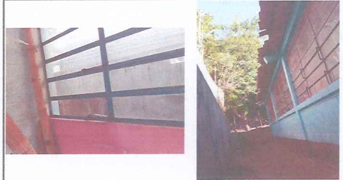
Foto 4: Ventana en mal estado, deterioro por oxido, antigüedad y vidrios rotos