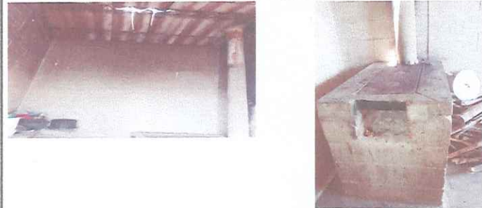
Foto 1: Cocina con techo deteriorado, sin repello, sin pila terminada, tubería de drenaje faltante.