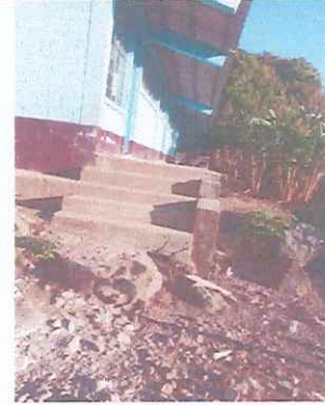
Foto 2: Tubería de drenajes en mal estado, planchas de corredor desaniveladas