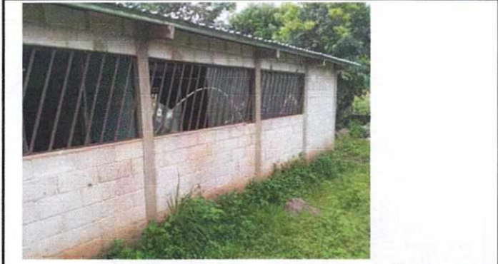
FOTO No. 02 Instalacion de balcones