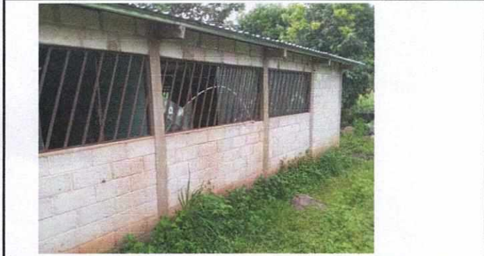
FOTO No.01 Cambio de ventanales