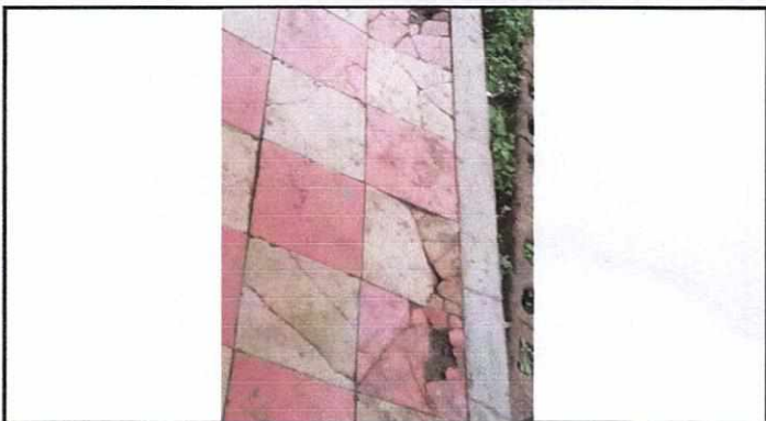
FOTO No.04 Sustitucion de piso