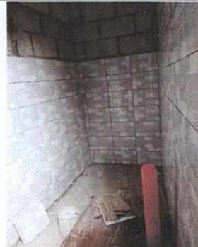
FOTO 4 AMPLIACIÓN DE SERVICIOS SANITARIOS