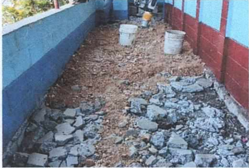
FOTO NO. 1 REPARACIÓN DE MURO DE CORREDOR