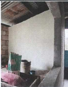
FOTO NO. 5 AMPLIACIÓN DE COCINA