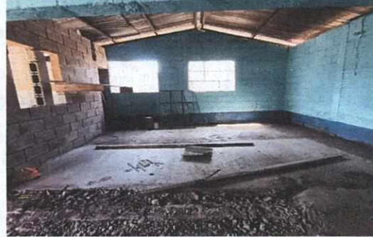
FOTO NO. 2 AMPLIACIÓN DE AULA