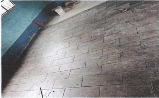
FOTO NO. 3 SUSTITUCIÓN DE PISO