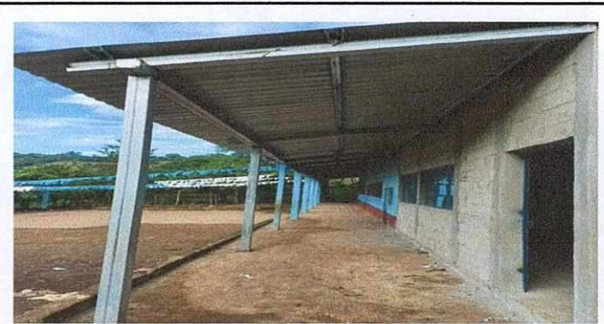
Foto 2: Colocación de estructura metálica y lámina troquelada en el corredor.