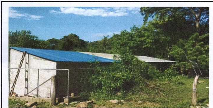
Foto 3: Colocación de lámina troquelada en salón de clases y corredor.