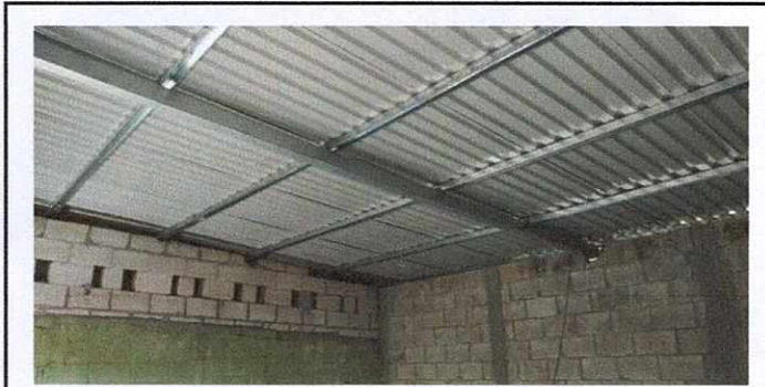
Foto 1: Colocación de estructura metálica y lámina troquelada en el salón de clases.