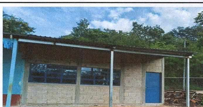
Foto 6: Proyecto concluido en la construcción del salón de clases.

Observación: Si es necesario se pueden agregar hojas adicionales y actualizar el número de hojas.