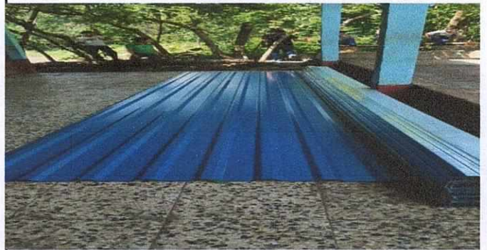
Foto 2: Recepción de estructura metálica y lámina para instalación de techo en salón de clases y corredor.