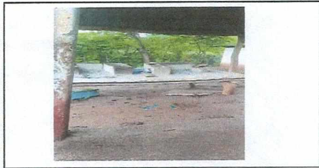
FOTO No. 5 Cocina sin paredes