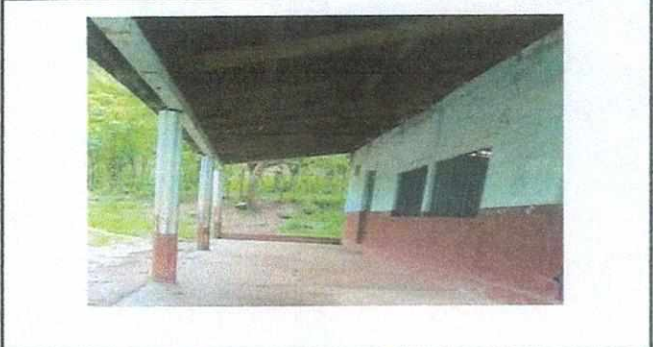
FOTO No. 2 Techo del corredor