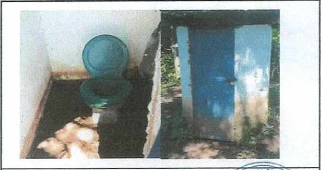
FOTO. No. 6 Sustitución de baños

Observación: Si es necesario se pueden agregar hojas adicionales y actualizar el número de hojas.