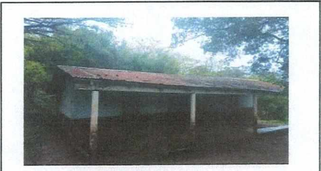
FOTO No.4 sustitución de paredes