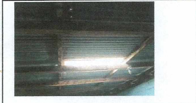
FOTO No. 1 Techo en mal estado de los salones de clase