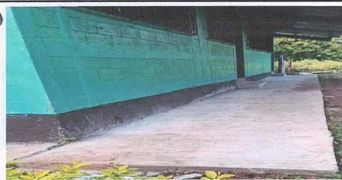
Foto 5: nueva banqueta de torta de cemento, parte frontal de los salones.

Observación: Si es necesario se pueden agregar hojas adicionales y actualizar el número de hojas.