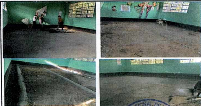
Foto 5: remoción de piso en mal estado, nivelación de suelo, fundición de base para colocación de piso.