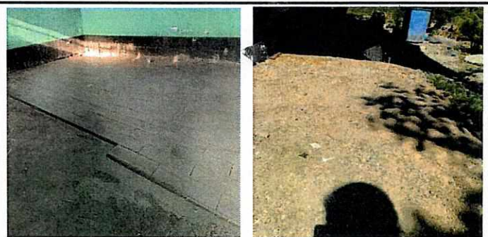
Foto 6: Colocación de piso cerámico, remoción de torta de cemento en la parte frontal de los salones.

Observación: Si es necesario se pueden agregar hojas adicionales y actualizar el número de hojas.