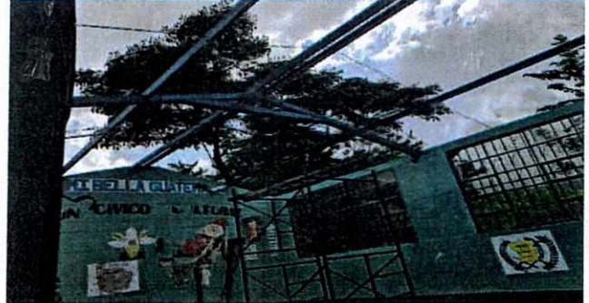
Foto 2: Colocación de refuerzo y aplicación de pintura a estructura metálica del techo