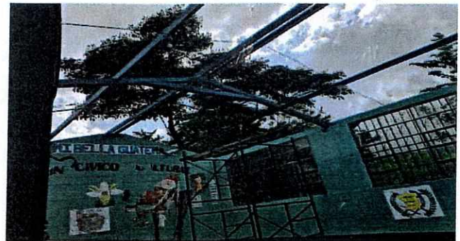
Foto 2: Colocación de refuerzo y aplicación de pintura a estructura metálica del techo