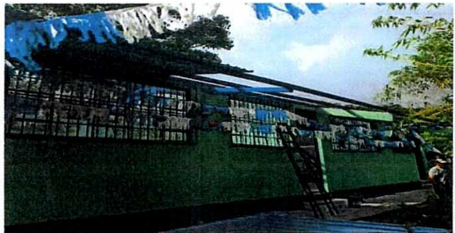
Foto 4: Colocación de nuevo techo de lámina troquelada, calibre 26