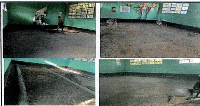
Foto 5: remoción de piso en mal estado, nivelación de suelo, fundición de base para colocación de piso.