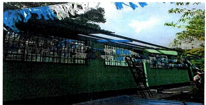
Foto 4: Colocación de nuevo techo de lámina troquelada, calibre 26