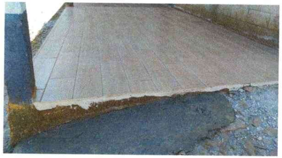
Foto 6: Terminación de colocación de piso cerámico en una parte del corredor

Observación: Si es necesario se pueden agregar hojas adicionales y actualizar el número de hojas.