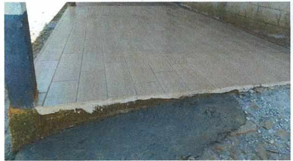
Foto 6: Terminación de colocación de piso cerámico en una parte del corredor

Observación: Si es necesario se pueden agregar hojas adicionales y actualizar el número de hojas.