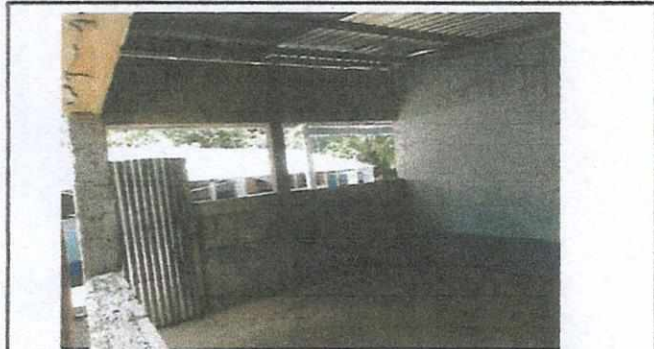
mejoramiento de aula