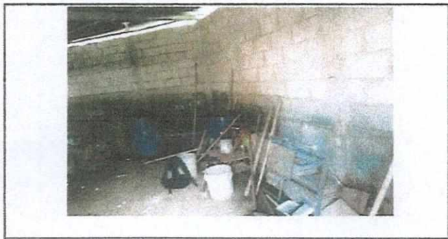
sustitución de baños labables