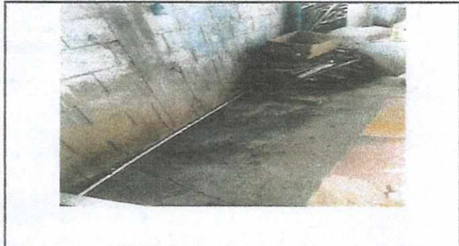
implementación de mesa para alimentos