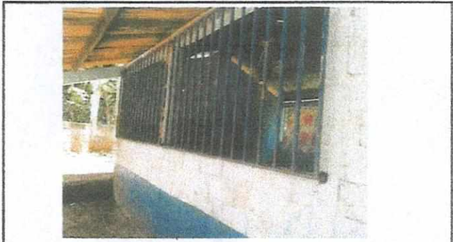
mejoramiento de aula