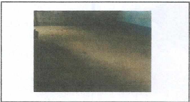
sustitución de baños labables

Observación: Si es necesario se pueden agregar hojas adicionales y actualizar el número de hojas.