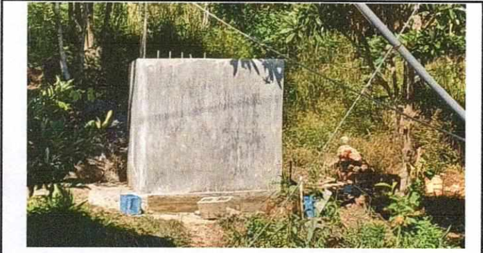
FOTO No. 01 REFORZAMIENTO DE SISTERNA