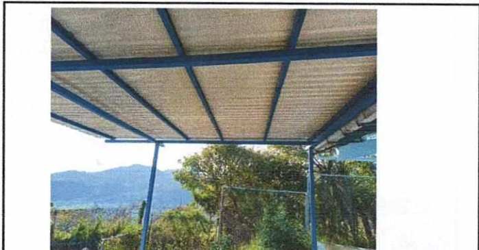
FOTO No.02 SUSTITUCION DE TECHO DE CORREDOR