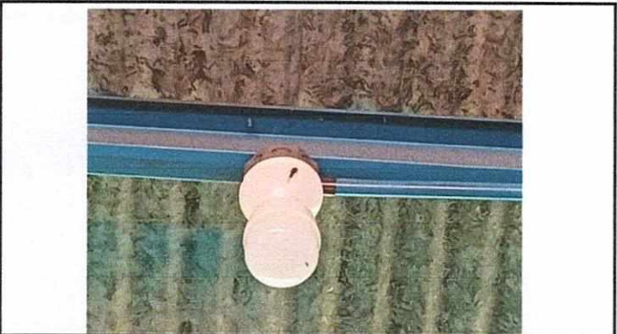
FOTO. No. 03 INTRODUCCION DE ENERGIA ELECTRICA