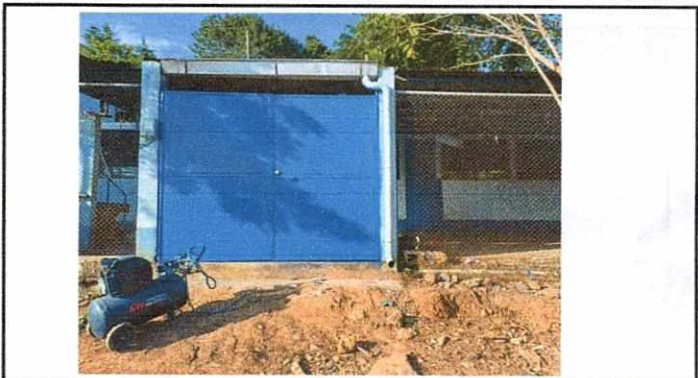
FOTO No, 04 SUSTITUCION DE PORTONES