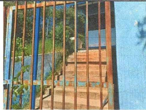
FOTO No.04 SUSTITUCION DE PORTONES