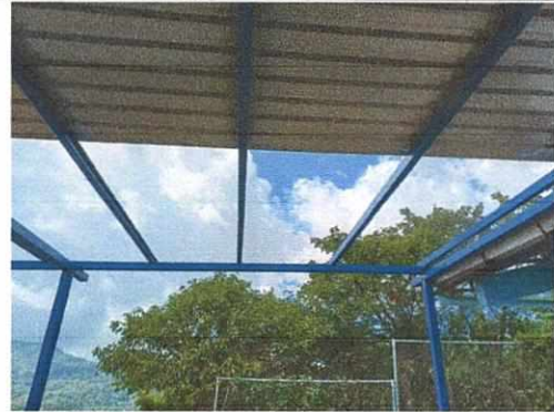
FOTO No.02 SUSTITUCION DE TECHO DE CORREDOR