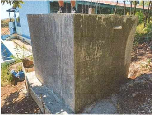
FOTO No. 01 REFORZAMIENTO DE SISTERNA