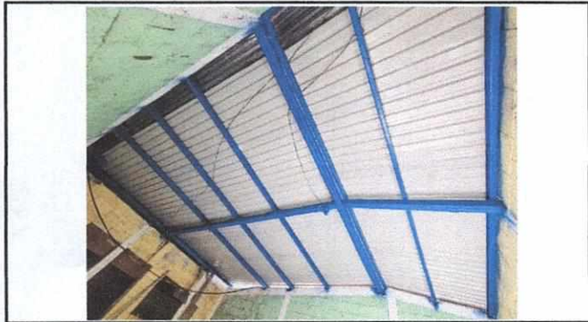
FOTO 1 REPARACIÓN DE LÁMINA