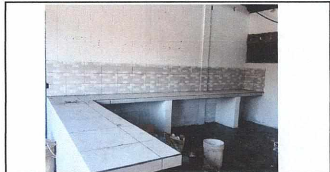
FOTO 6 CONSTRUCCIÓN MESA DE CONCRETO

Observación: Si es necesario se pueden agregar hojas adicionales y actualizar el número de hojas.