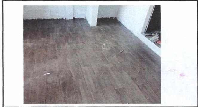
FOTO 4 INSTALACIÓN DE PISO CERAMICO