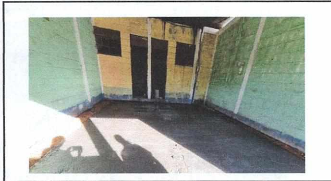
FOTO 3 FUNDICIÓN DE TORTA DE CEMENTO