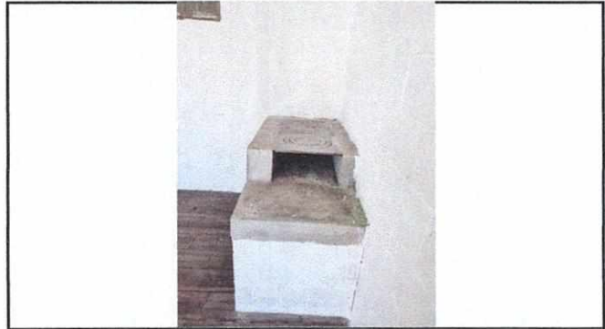
FOTO 2 ELABORACIÓN DE COCINA CON CHIMENEA