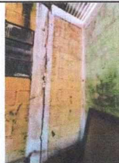
FOTO No. 06 Reparacion de pared de aula

Observación: Si es necesario se pueden agregar hojas adicionales y actualizar el número de hojas.