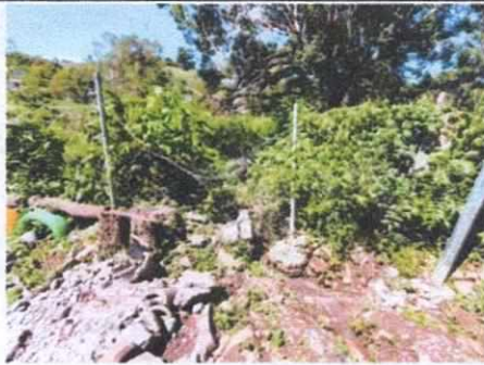
FOTO No. 03 Muro perimetral reparacion