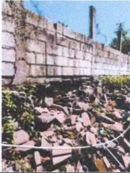
FOTO No. 01 Reparacion muro perimetral