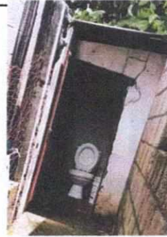
FOTO No.04 Reparacion de servicios sanitarios