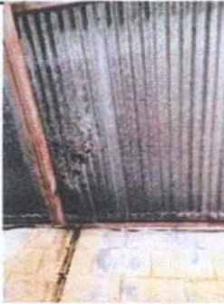
FOTO No. 05 Reparacion de pared de aula