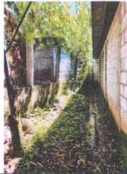
FOTO No. 02 Reparacion muro perimetral