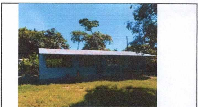
FOTO No. 4 SUSTITUCION DE TECHO DE AULAS

Observación: Si es necesario se pueden agregar hojas adicionales y actualizar el número de fotos.