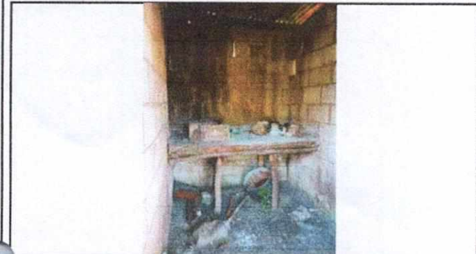
FOTO No. 1 SUSTITUCION DE PAREDES POR AMPLIACION DE COCINA Y SUSTITUCION DE PLANCHA