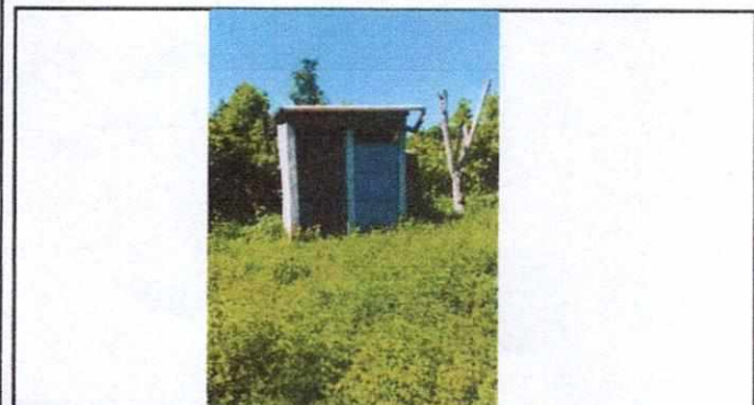
FOTO No. 3 INSTALACION DE UNA PUERTA METALICA Y UN TINACO