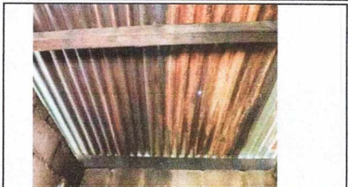
FOTO No.2 SUSTITUCION DE TECHO Y COSTANERA