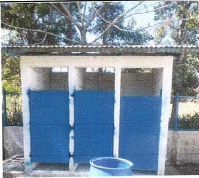
FOTO No.03 INSTALACION DE TECHO EN MODULOS DE BAÑOS

Observación: Si es necesario se pueden agregar hojas adicionales y actualizar el número de hojas.