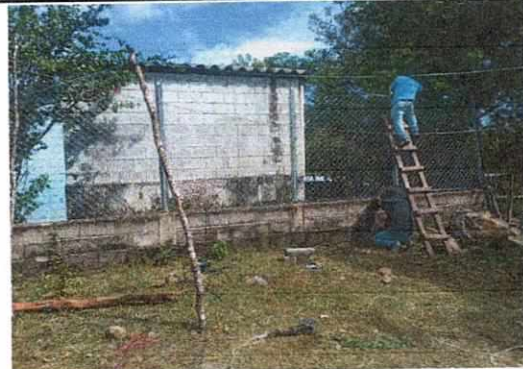
FOTO No.02 SUSTITUCION DE MALLA METALICA CON TUBO GALBANIZADO