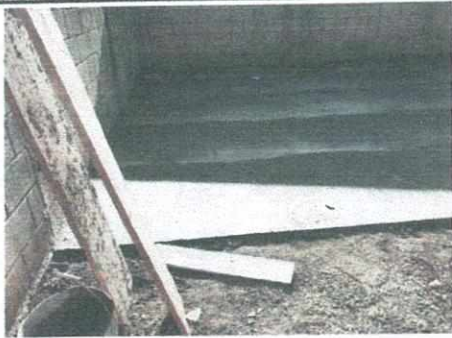
FOTO NO.03 FUNDICION DE LOSA EN AULA

Observación: Si es necesario se pueden agregar hojas adicionales para actualizar el número de hojas.