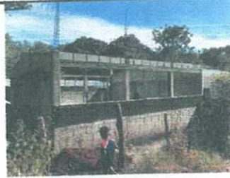
FOTO. No.02 LEVANTADO DE AULA SOLO AUMENTARLE UN POCO