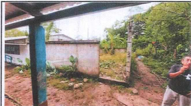
FOTO No. 02 Instalacion de puerta