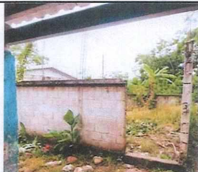
FOTO No. 05 Instalacion y construccion de piso de concreto

Observación: Si es necesario se pueden agregar hojas adicionales y actualizar el número de hojas.