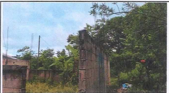
FOTO No.03 Instalacion de balcones metalicos