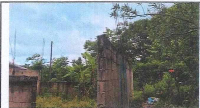
FOTO No. 04 Muro perimetral