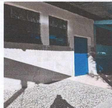
Foto 6: Sustitución de techo e implementación de puertas y balcones.

Observación: Si es necesario se pueden agregar hojas adicionales y actualizar el número de hojas.