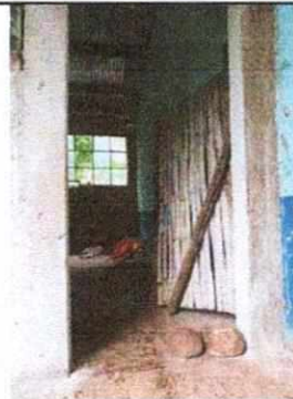
FOTO No.04 Puerta