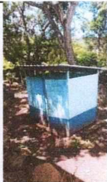
FOTO No.05 Sustitución de paredes baño, piso y puerta