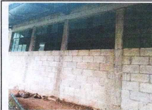
FOTO No.03 Ventanales, puerta y piso