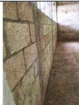
FOTO No. 06 Instalación de piso

Observación: Si es necesario se pueden agregar hojas adicionales y actualizar el número de hojas.