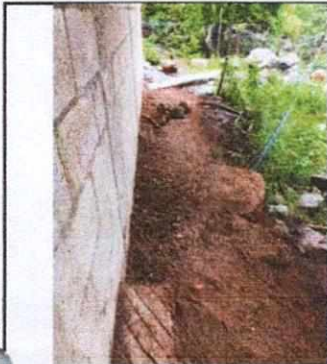
FOTO No. 01 Muro Perimetrak