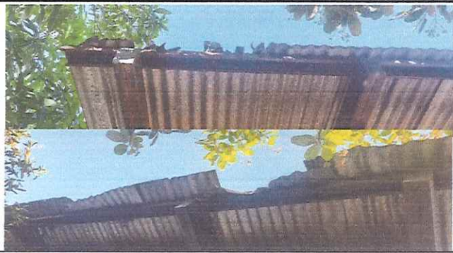
Sustitución de lamina y mantenimiento de estructura de aulas