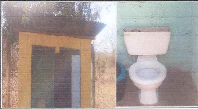
Sustitución de estructura metalica, lamina y un sanitario