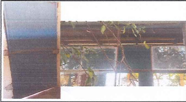
Mantenimiento de puertas mas chapas y balcones.