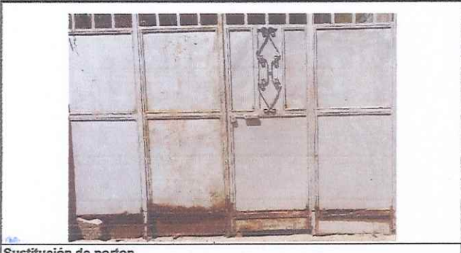
Sustitución de porton

Observación: Si es necesario se pueden agregar hojas adicionales y actualizar el número de hojas.