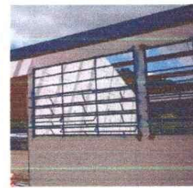
FOTO 4. MANTENIMIENTO E INTALACIÓN DE VIDRIOS