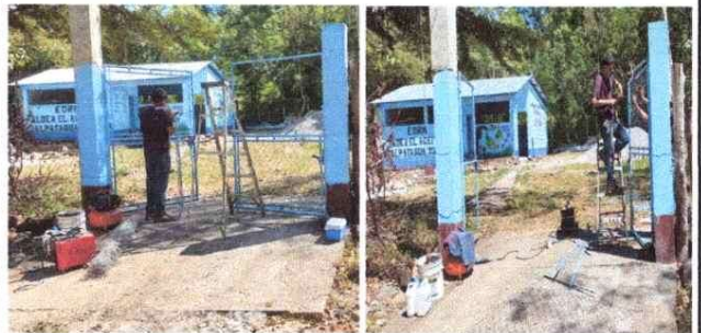
Reparación del portón principal