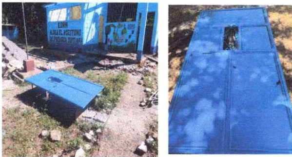
Pintura en puertas.