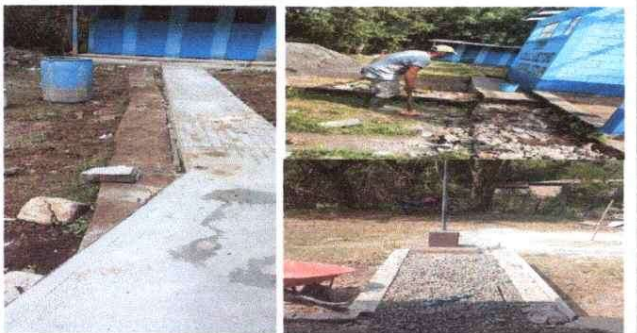
sustitución de banquetas, en aulas, sanitarios y cocina.