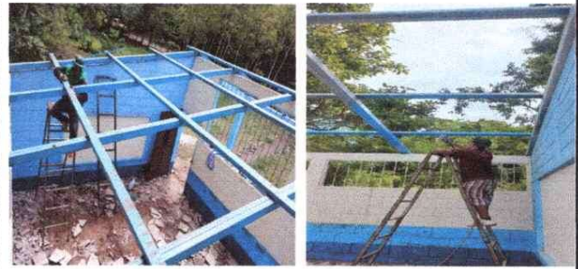
Pintura en costaneras existentes.