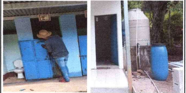
Pintura en puertas, instalación de agua, y reparación de la red de agua potable.