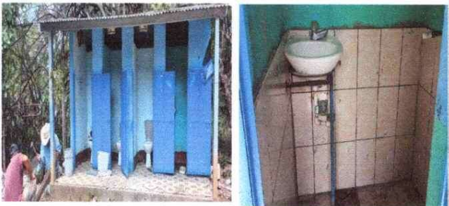
instalación de piso en sanitarios y azulejo en lavamanos.