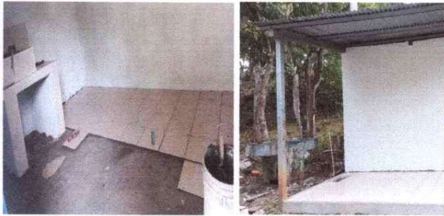
Sustitución de torta más instalación de piso. sustitución de pila.