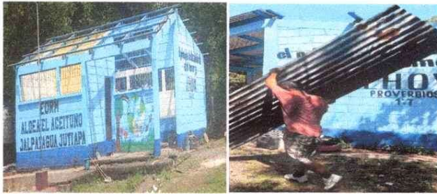
Sustitución de lámina por lámina troquelada calibre 26.