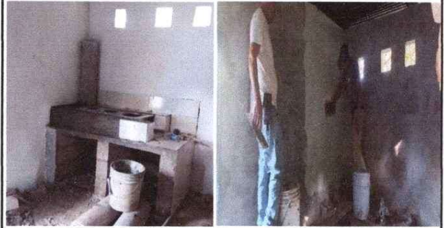
Remozamiento de cocina de leña. Repello y cernido en interior