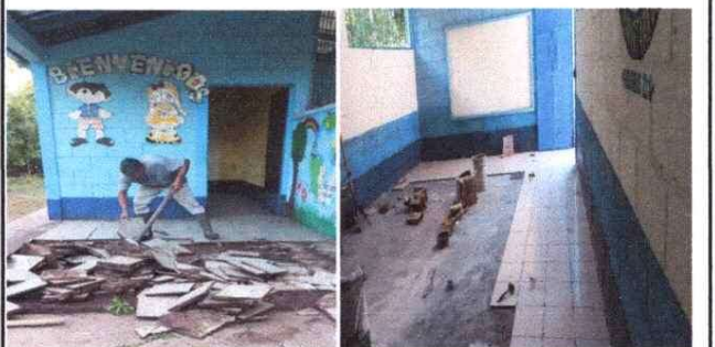
Demolición y retiro de piso de granito existente, fundición de base e instalación de piso.

Observación: Si es necesario se pueden agregar hojas adicionales y actualizar el número de hojas.