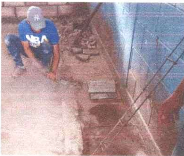
Sustitución de piso de torta de concreto