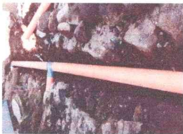
Sustitución de tuberías PVC línea principal aguas negras