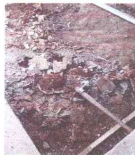
Reparación de banquetas de concreto