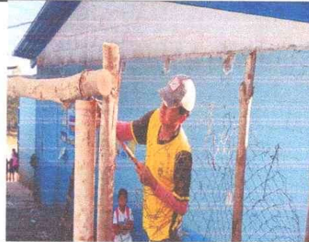
Sustitución de estructura de madera por estructura de metal