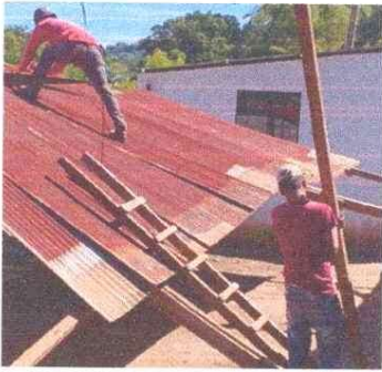
Sustitución de lámina, por lamina troquelada aluzinc calibre 26