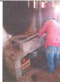
Sustitución de estufa rural (completa) incluye chimenea y plancha de metal

Observación: Si es necesario se pueden agregar hojas adicionales y actualizar el número de hojas.