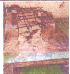
Sustitución de estufa rural (completa) incluye chimenea y plancha de metal

Observación: Si es necesario se pueden agregar hojas adicionales y actualizar el número de hojas.