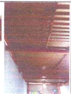
Sustitución de estructura de madera por estructura de metal