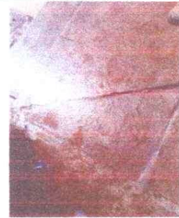
Reparación de banquetas de concreto