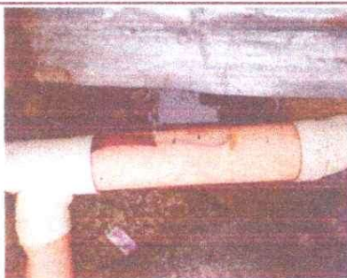
Sustitución de tuberías PVC línea principal aguas negras