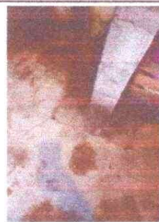
Sustitución de piso de torta de concreto