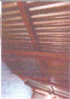
Sustitución de lámina, por lamina troquelada aluzinc calibre 26