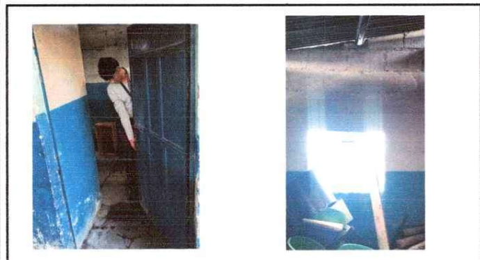
Pintura en puerta