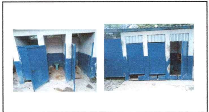
sustitución de puertas