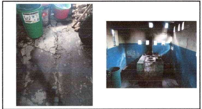
sustitución de torta por piso