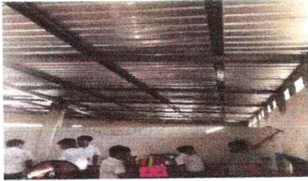
Sustitución de lamina por lamina troquelada y mantenimiento de estructura de dos aulas