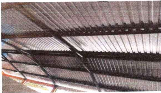
Sustitución de lamina por lamina troquela y estructura metalica

Observación: Si es necesario se pueden agregar hojas adicionales y actualizar el número de hojas.