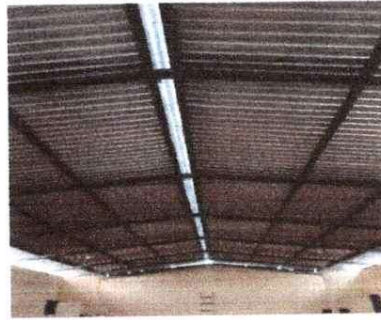
Sustitución de estructura de metal en la cocina.