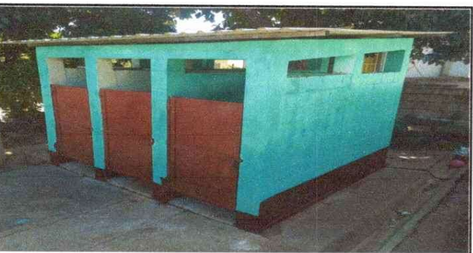
Foto 5 Mantenimiento a estructura (lijado, cambio de tubo, cepillado aplicación de pintura) a puertas de sanitarios