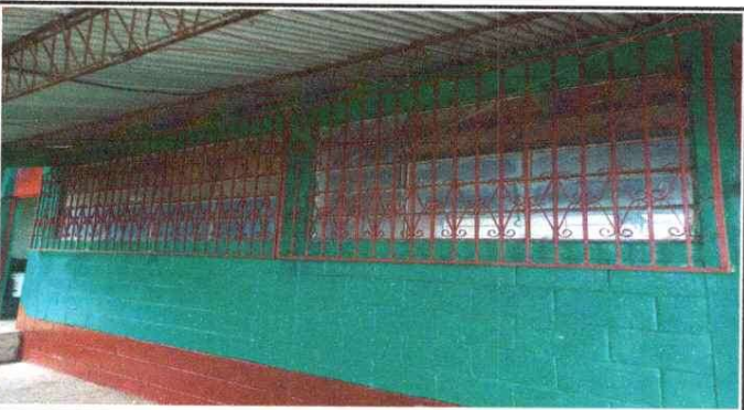
Foto 3 Mantenimiento de balcones de metal