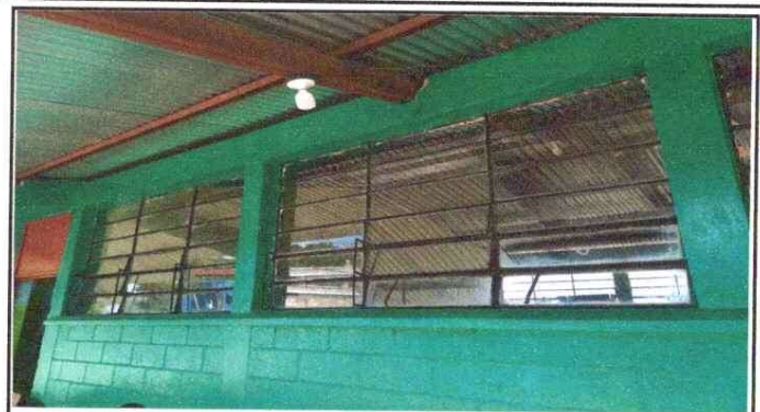
Foto 2 Mantenimiento a estructura de ventana de metal y sustitucion de vidrios