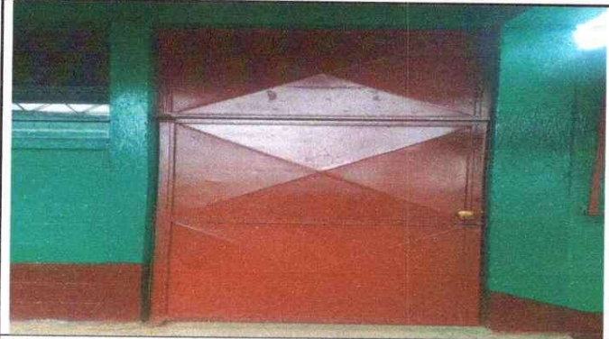
Foto 1 Mantenimiento a estructura (lijado, cambio de tubo, cepillado, aplicación de pintura de puertas)