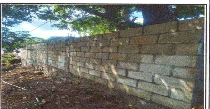
Foto 6 Reparacion de muro perimetral

Observación: Si es necesario se pueden agregar hojas adicionales y actualizar el número de hojas.