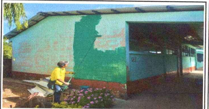
Foto 4 Pintura en muros exteriores e interiores