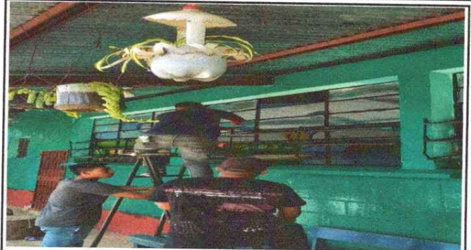
Foto 2 Mantenimiento a estructura de ventana de metal y sustitucion de vidrios