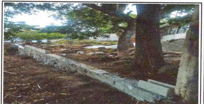
Foto 6 Reparacion de muro perimetral

Observación: Si es necesario se pueden agregar hojas adicionales y actualizar el número de hojas.