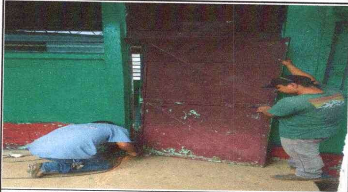
Foto 1 Mantenimiento a estructura (lijado, cambio de tubo, cepillado, aplicación de pintura de puertas