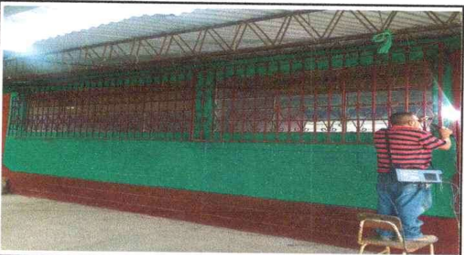
Foto 3 Mantenimiento de balcones de metal