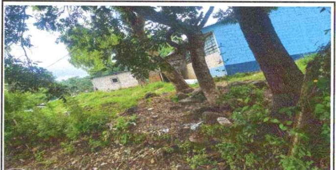
FOTO 6 Reparación de muro perimetral

Observación: Si es necesario se pueden agregar hojas adicionales y actualizar el número de hojas.