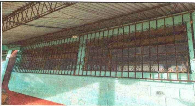
FOTO 3 mantenimiento de balcones de metal