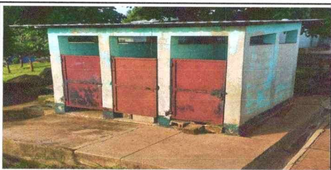
FOTO 5 mantenimiento a estructuras (lijado, cambio de tubo, cepillado aplicación de pintura) a puertas de sanitarios