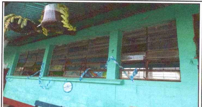
FOTO 2 mantenimiento a estructura de metal de ventana y cambio de vidrios