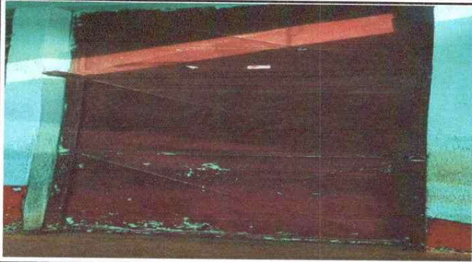
FOTO 1 mantenimiento a estructura (lijado, cambio de tubo, cepillado, aplicación de pintura de puertas