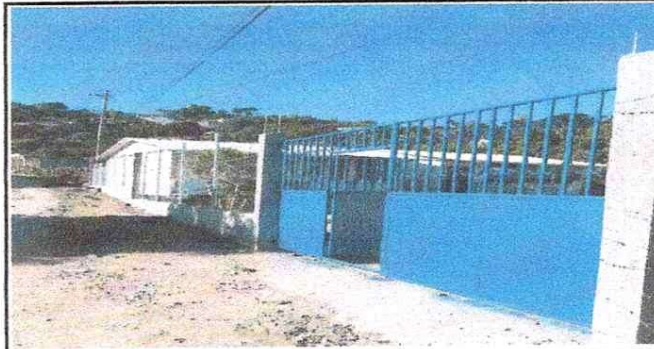
NOTA: Muro perimetral frontal con porton finalizado.

Observación: Si es necesario se pueden agregar hojas adicionales y actualizar el número de hojas.