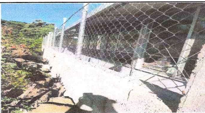
NOTA: Muro lateral izquierdo.