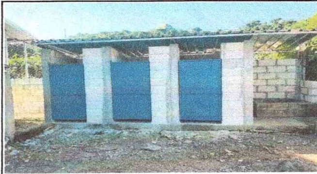
NOTA: Baños finalizados.