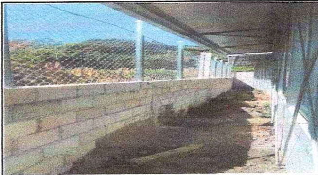
NOTA: Muro finalizado.