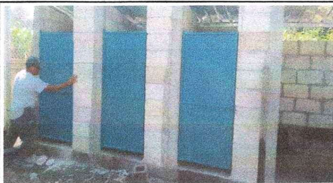
NOTA: Instalacion de puertas de baños.