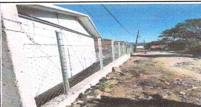
NOTA: Muro perimetral frontal finalizado.