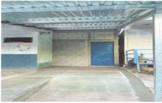
AMPLIACION DE COCINA