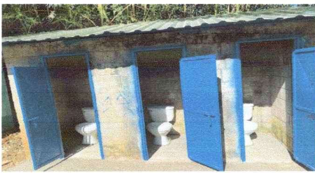
MEJORAMIENTO EN ACCESORIOS DE SANIRARIOS