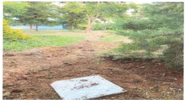
MEJORAMIENTO EN DRENAJES DE COCINA