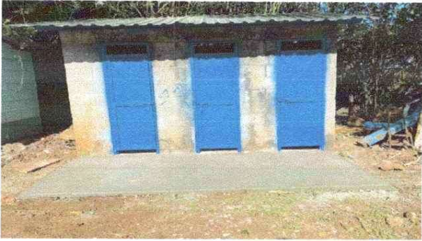
MEJORAMIENTO EN SANITARIOS