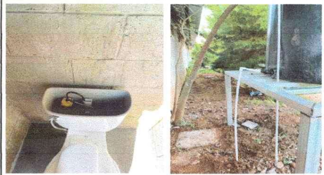
MEJORAMIENTO EN ACCESORIOS DE SANITARIOS Y TUBERIA PVC