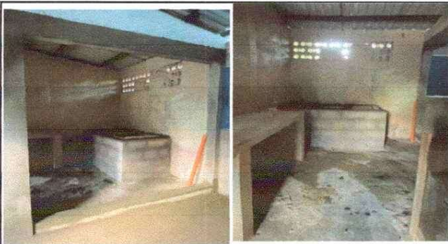
SUSTITUCIÓN DE PILA