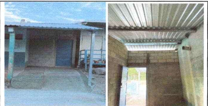
AMPLIACIÓN DE COCINA

Observación: Si es necesario se pueden agregar hojas adicionales y actualizar el número de hojas.