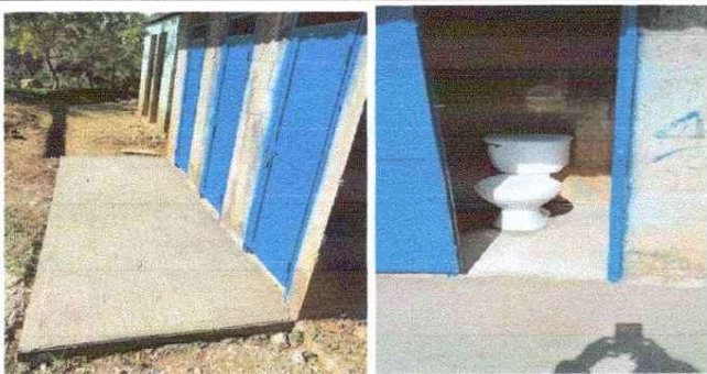
MEJORAMIENTO EN PISO DE SANITARIOS