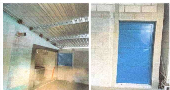
MEJORAMIENTO EN TECHO Y PUERTA DE COCINA

Observación: Si es necesario se pueden agregar hojas adicionales y actualizar el número de hojas.