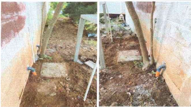
MEJORAMIENTO DE DRENAJES DE COCINA