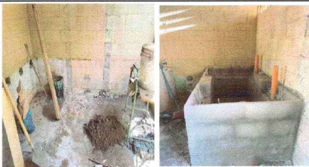
SUSTITUCIÓN DE PILA