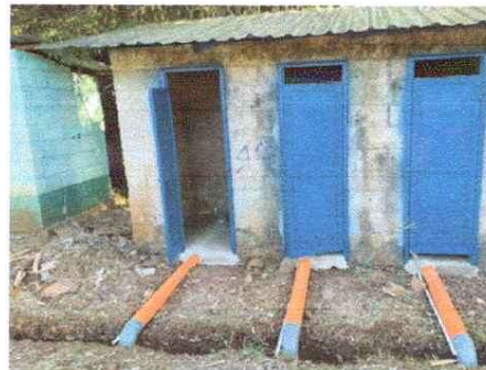
MEJORAMIENTO EN TUBERIA DE SANITARIOS