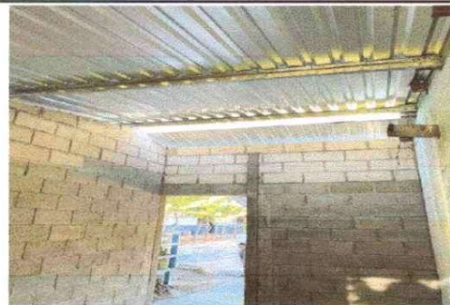
MEJORAMIENTO EN TECHO Y PUERTA DE COCINA

Observación: Si es necesario se pueden agregar hojas adicionales y actualizar el número de hojas.