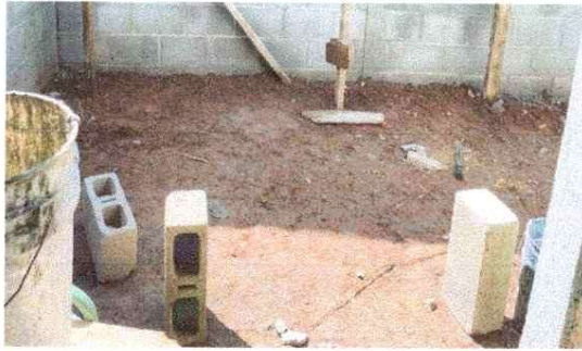
MEJORAMIENTO DE PISO DE CONCRETO