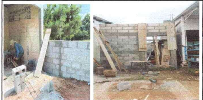
AMPLIACION DE COCINA

Observación: Si es necesario se pueden agregar hojas adicionales y actualizar el número de hojas.