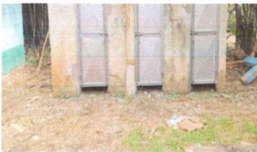
MEJORAMIENTO EN PISO DE SANITARIOS