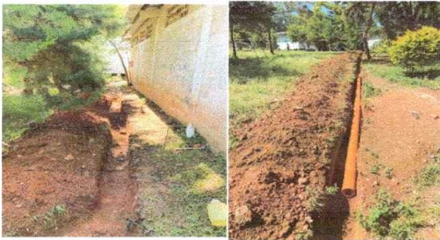
MEJORAMIENTO DE DRENAJES