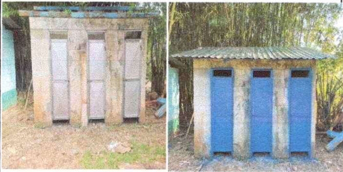
MEJORAMIENTO EN SANITARIOS