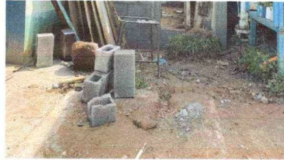
MEJORAMIENTO DE PISO DE CONCRETO