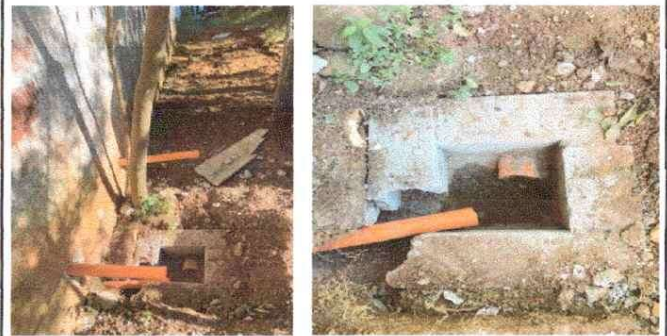
MEJORAMIENTO EN COCINA