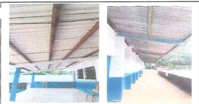
Mejoramiento en sistema electrico