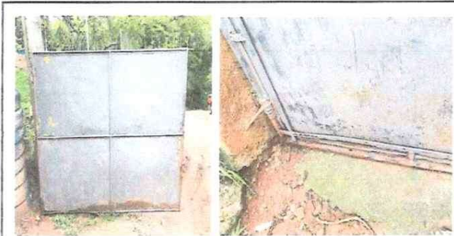
Mantenimiento a porton Principal