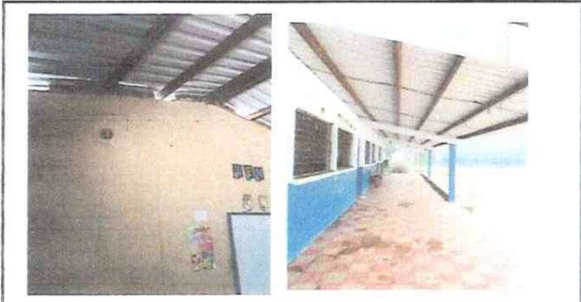
Pintura de exteriores e interiores