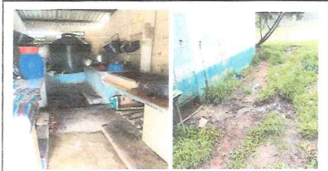
Remozamiento de cocina