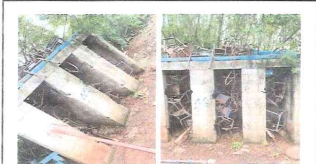
Habilitación de sanitarios