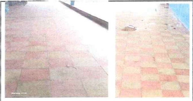
Sustitución de piso

Observación: Si es necesario se pueden agregar hojas adicionales y actualizar el número de hojas.