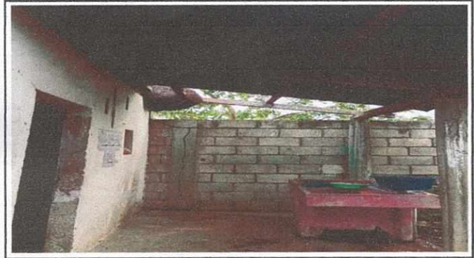
Foto.3 Reparacion de piso de concreto