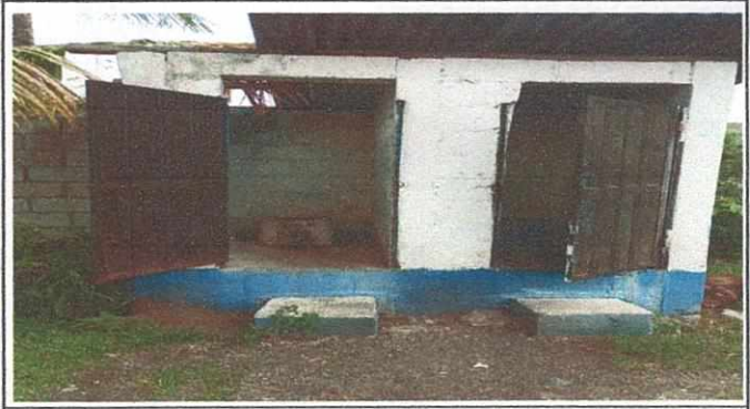
Foto.4 Reparacion de sanitarios y puertas