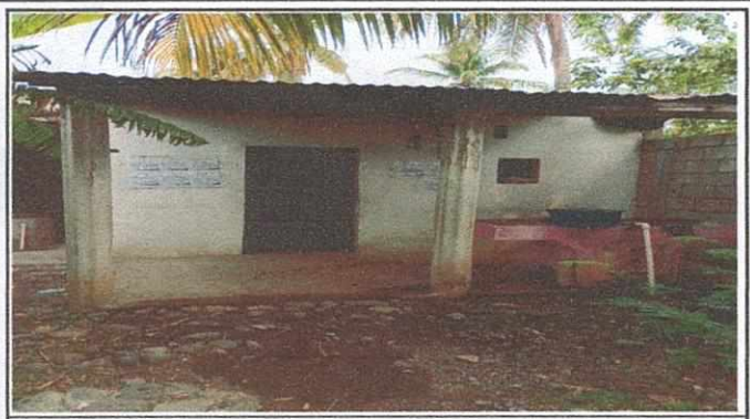
Foto.1 Cambio de techo y estructura metalica a cocina