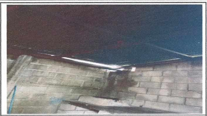
Foto.2 Repello cernido y chimenea a cocina