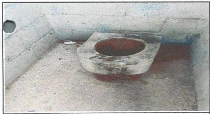
Foto. 5 Instalacion de tasas de china a sanitarios