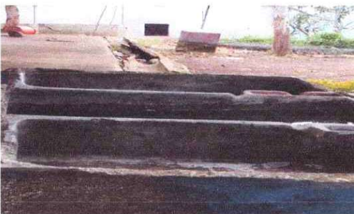
mejoramiento de la pila de la cocina