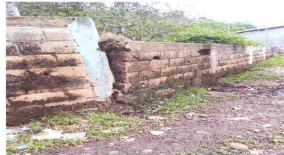
mejoramiento del muro de contención