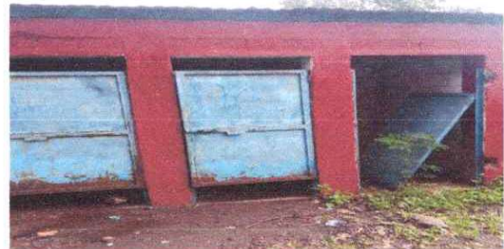
mejoramiento de los baños