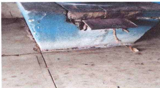
Reparación de polleton