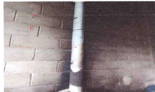
sustitución de la chimenea

Observación: Si es necesario se pueden agregar hojas adicionales y actualizar el número de hojas.