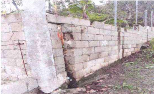
mejoramiento del muro perimetral