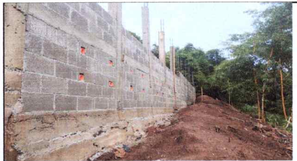
Muro en construcción 36 metros de largo.