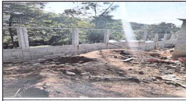
fotografía tomada desde la parte entre los servicios sanitarios.

Observación: Si es necesario se pueden agregar hojas adicionales y actualizar el número de hojas.