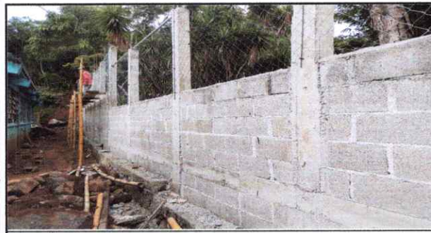
fotografía de parte trasera donde se construye muro.