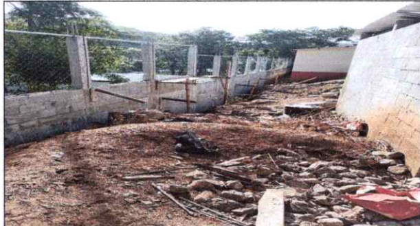
Parte trasera de los servicios sanitarios en construcción.