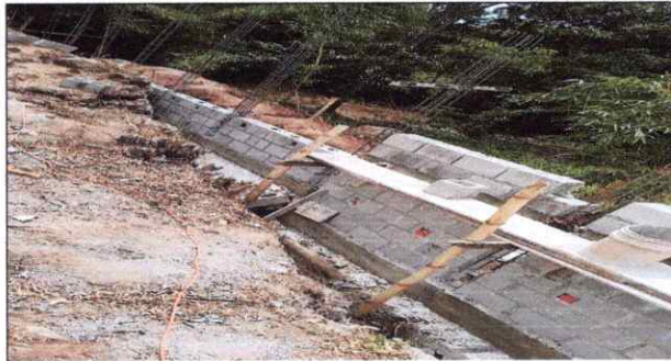
Parte frontal del establecimiento en construcción