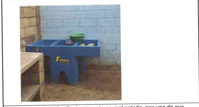
NOTA: Se sustituyo la pila de cemento en mal estado, por una de pvc.