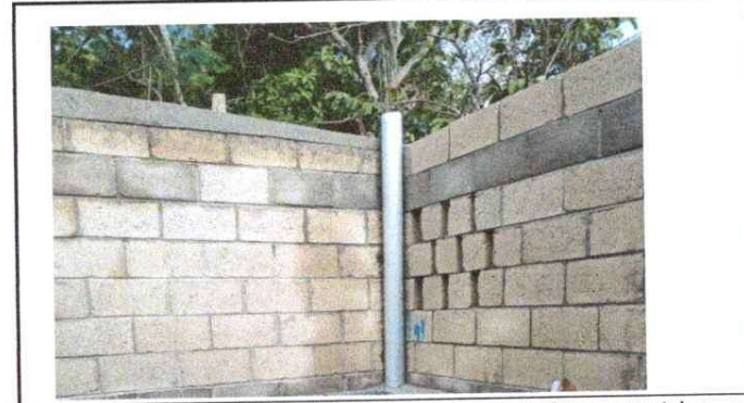
NOTA: se sustituyeran la estructura de la vigas de madera por metal y colcaran techo de lamina.