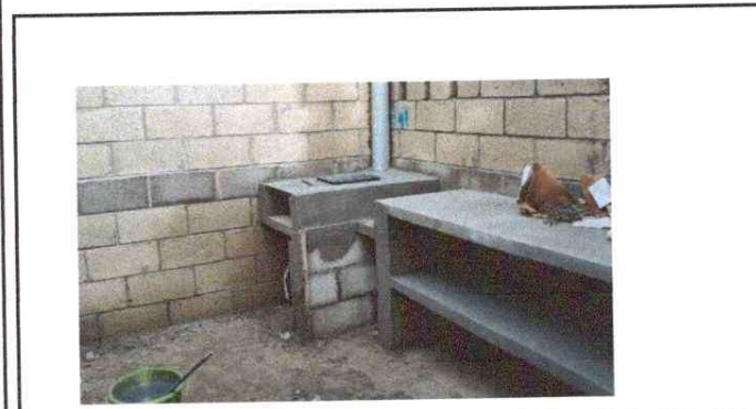
NOTA: se sustituyo el polleton de varas y barro por una plancha.