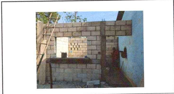
NOTA: Se rediseño la fachada d la cocina