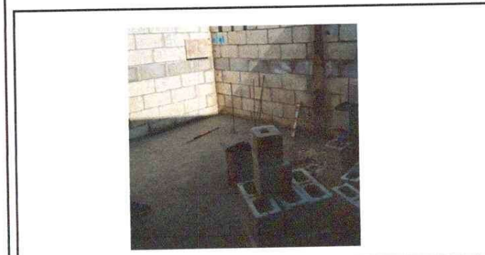
NOTA: Se fundio totra de cemento