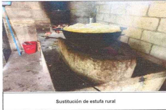
Sustitución de estufa rural