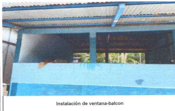
Instalación de ventana-balcon