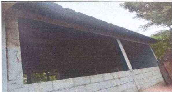
Instalación de ventana-balcon