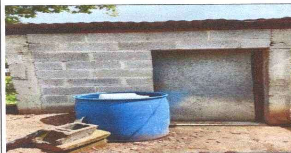
Sustitución de puerta de sanitarios