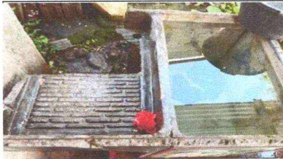
Sustitución por pila de cemento dos lavaderos para la cocina