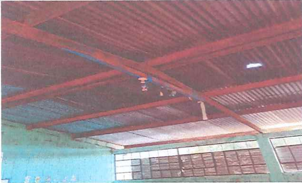
foto 1. muestra la parte de adentro del techo.