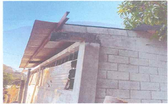
foto 2. muestra la parte de afuera del techo