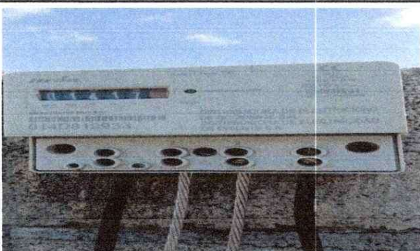
Reparación del Sistema Electrico