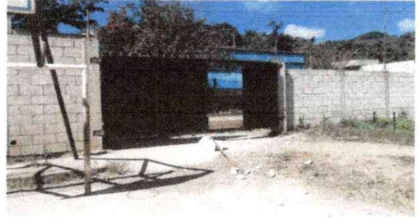
Reparación e Insalación de Porton