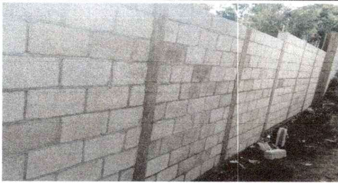
Reparación de Muro Perimetral