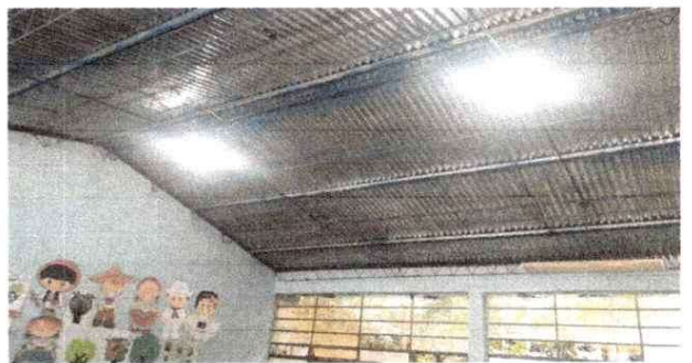
Reparación de lamparas

Observación: Si es necesario se pueden agregar hojas adicionales y actualizar el número de hojas.