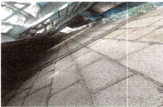
Reparación de Muro perimetral