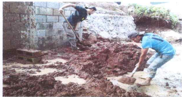
limpieza en muro de contencion