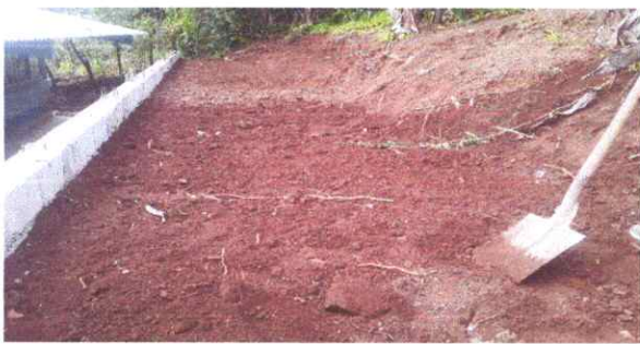
Compactacion del muro de contencion