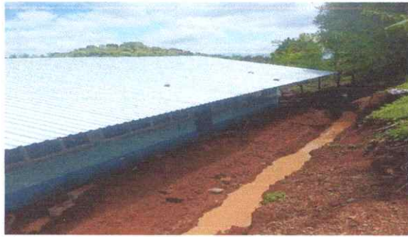
Sanjeo para columnas