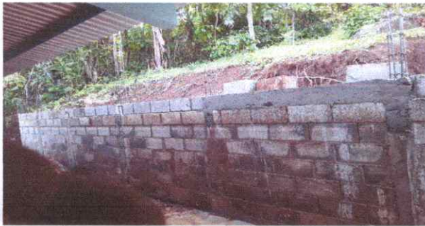
levantado de muro de contención