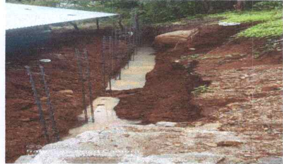
colocacion de columnas