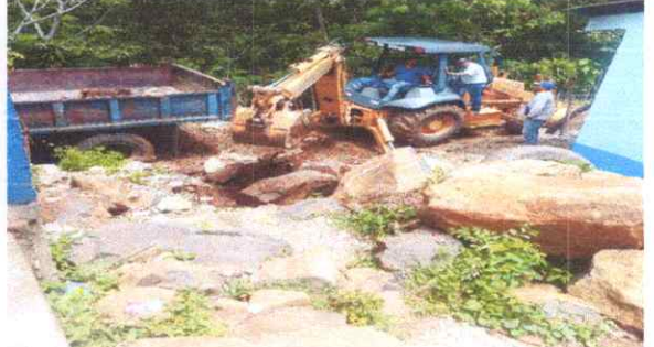
Extraccion y movimiento de tierra

Observación: Si es necesario se pueden agregar hojas adicionales y actualizar.